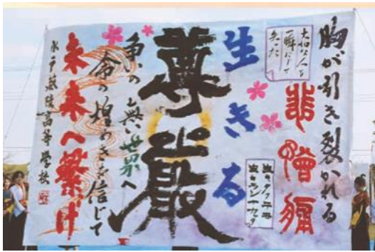
ふれあい祭り 書道パフォーマンス (水戸葵陵高校)