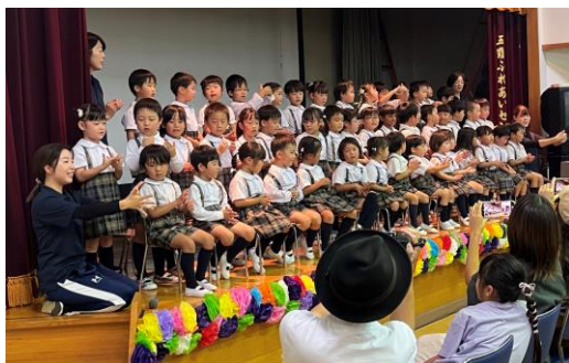
五霞町健康福祉まつり