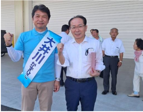
大井川知事 選挙応援