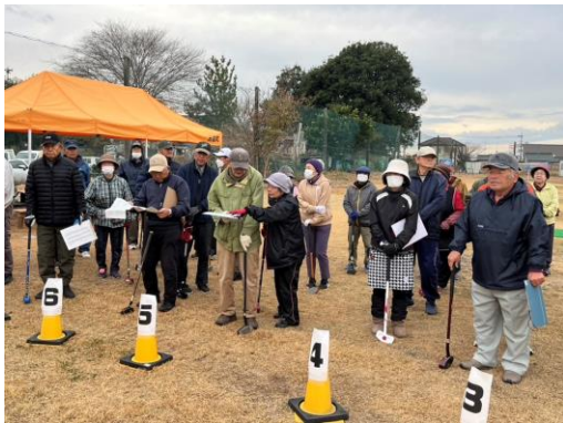
丸池台グラウンドゴルフプレオープン