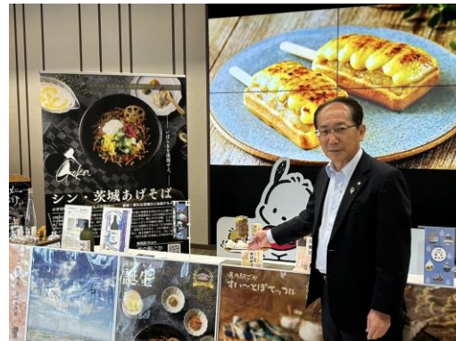
武蔵野銀行 本社にて