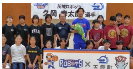
茨城ロボッツ選手 中学生指導