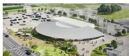
新庁舎複合施設外観イメージ