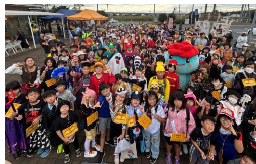
ハロウィンウォーク