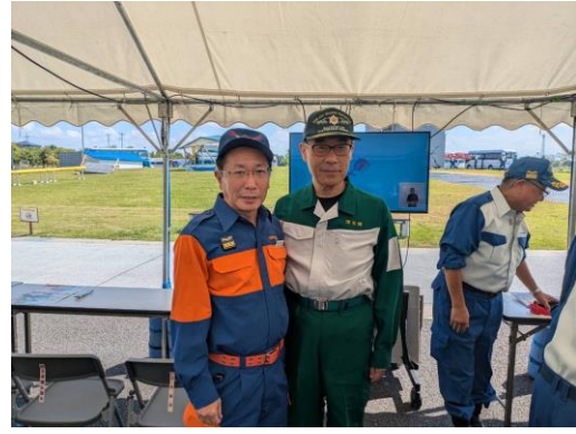
埼玉県大野知事 九都県市 合同防災訓練