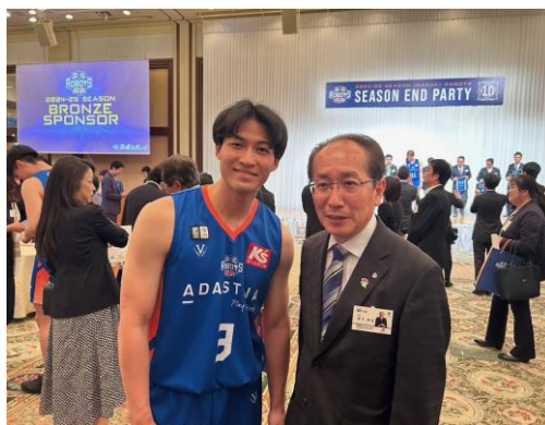
いばらきロボッツとのフレンドリータウン協定