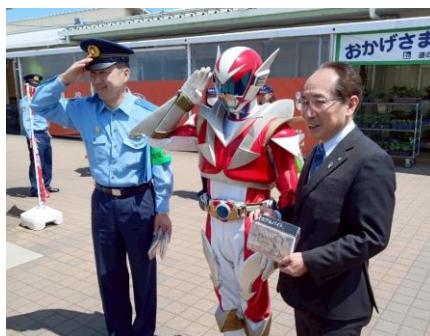
交通安全運動（境警察署長）