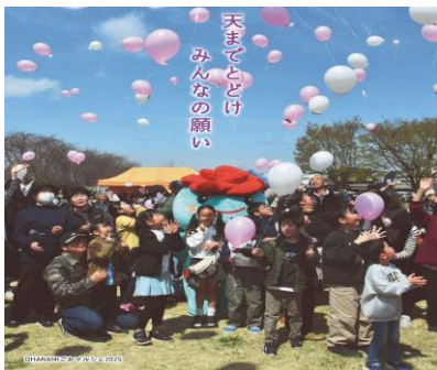
OHANAMI ごかマルシェ 2025 より