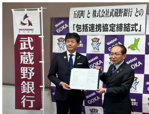
包括連携協定（武蔵野銀行頭取）